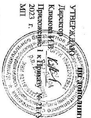
График образовательного процесса на 2024-2025 учебный год Дополнительным общеобразовательным программам